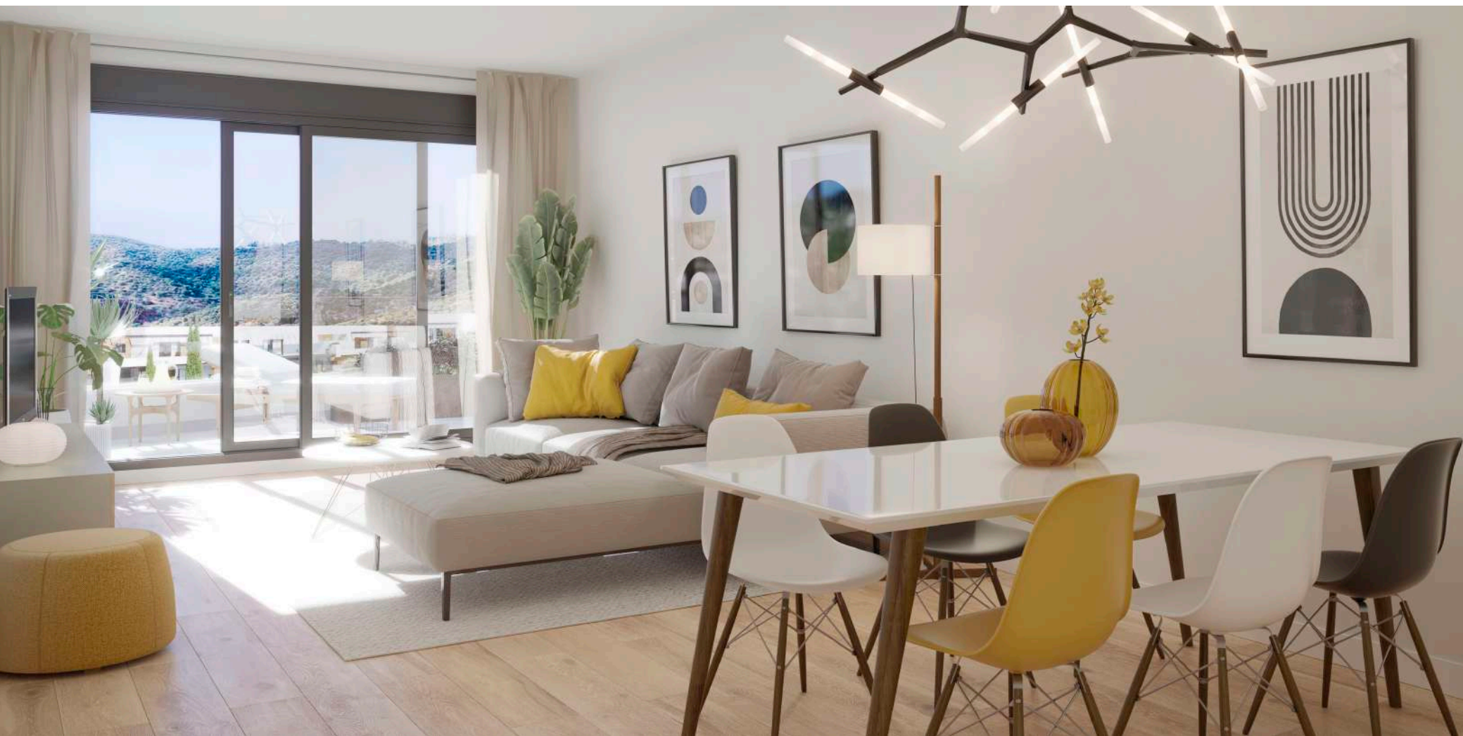
Interior de la vivienda. Acabados