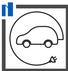
Preinstalación de carga vehículos