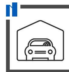
Acceso a garajes desde cada portal